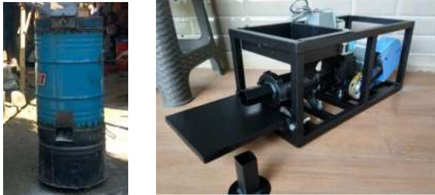
Gambar 1. (a) Drum Pembakaran Tempurung Kelapa, dan (b) Contoh Mesin Cetak Briket

Pada proses pembakaran tempurung kelapa, tempurung yang sudah terkumpul dapat dilakukan proses pemecahan tempurung kelapa agar tidak terlalu besar sehingga akan mempermudah dan mempercepat proses pembakaran. Proses pembakaran tempurung kelapa yang baik dilakukan dengan proses pirolisis(6). Pada proses pirolisis, udara suplai ke dalam drum pembakaran harus dikendalikan. Arang tempurung kelapa yang baik memiliki kadar air, zat terbang dan kadar abu yang rendah, dimana berdasarkan SNI 01-1682-1996 tentang kualitas/mutu arang tempurung kelapa yang baik memiliki bagian yang hilang ketika pemanasan berlangsung pada temperatur 950°C maksimum 15%, kadar air maksimum 6%, dan abu maksimum 3%(7).